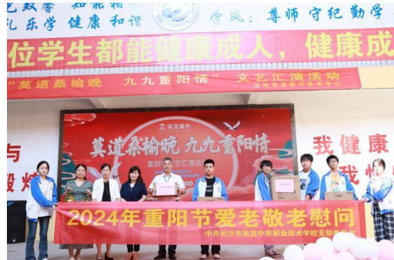
图9 重阳节敬老爱老慰问活动