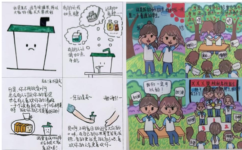
图 25 学生心理漫画作品 (部分)

学校高度重视学生心理健康教育，邀请专家开设心理健康讲座，并举办心理漫画比赛及展览，营造积极向上的心理健康教育氛围。