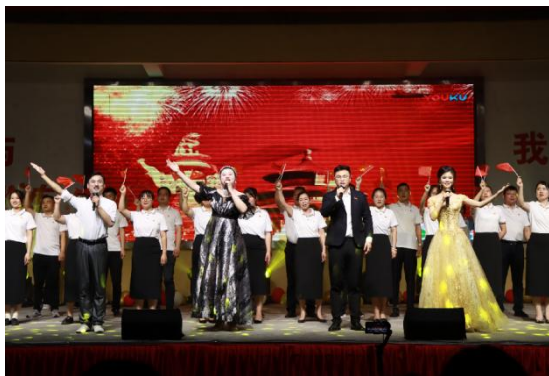
图8 歌唱《我和我的祖国》