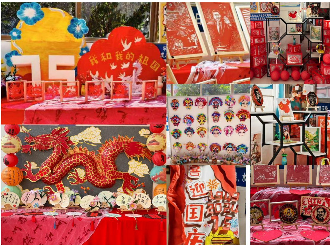
图 40 庆祝中国成立 75 周年非遗作品展