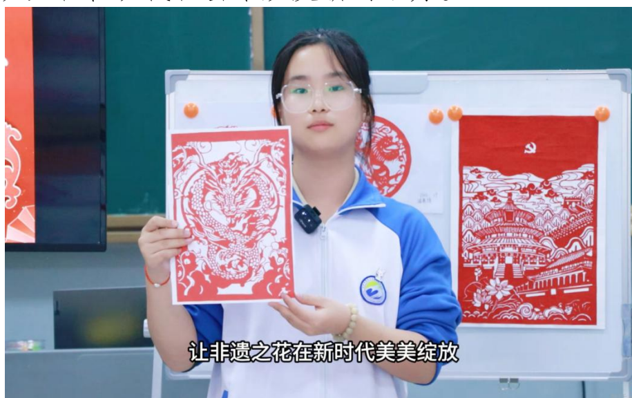
图 39 学生学习非遗刻纸

“传非遗”，中职学生传承非遗刻纸艺术，体悟非遗之美。刻纸作为一种非物质文化遗产，学生可以深入了解其历史背景和文化价值，增强对中华文化的认同感和自豪感。通过刻纸，学生不仅学习传统技艺，还能在此基础上进行创新，使传统文化在现代社会中焕发新的活力。