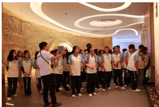
图 31 达嘉维康中医药科技文化馆研学活动