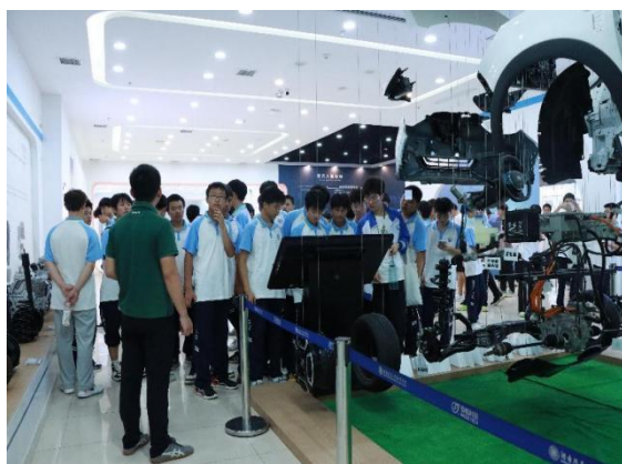
图 30 汽车文化馆参观活动