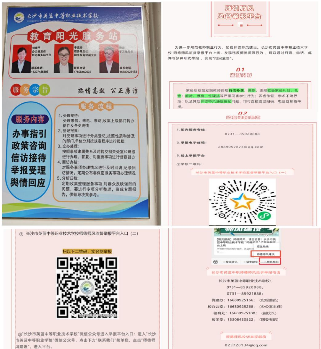
图 36 师德师风监督热线及网络举报平台

师德师风监督热线和网络举报平台，构建全方位、立体化的监督网络。通过开展批评与自我批评，深入剖析问题根源，制定切实可行的整改措施，确保问题整改到位、制度完善到位、机制健全到位。