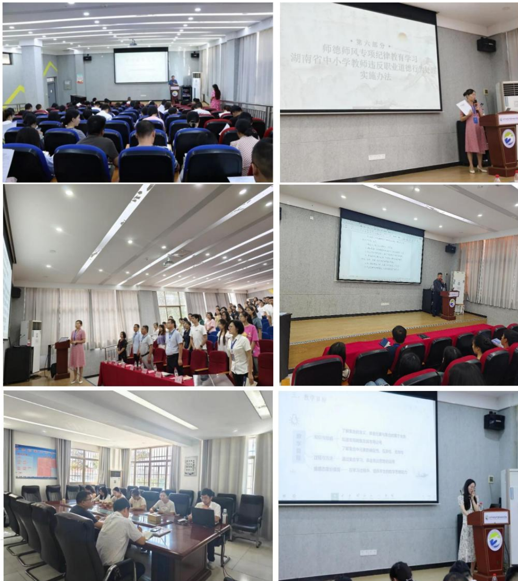
图 35 师德师风系列专题活动

深入学习《新时代中小学教师职业行为十项准则》等法规文件，推动师德师风教育入脑入心。建立“线上+线下”立体化学习平台，实现师德教育常态化、制度化、规范化。