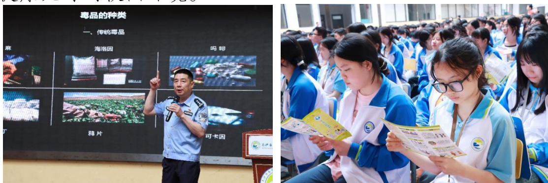
图 17 禁毒宣传教育活动

学校联合天心区禁毒办、社会禁毒协会、桂花坪街道禁毒分会及新起点同伴禁毒教育服务中心，开展了禁毒宣传教育巡回宣讲活动。通过专题讲座、案例剖析、互动问答等形式，向学生普及禁毒知识，增强学生的防毒拒毒意识，营造健康无毒的校园环境。