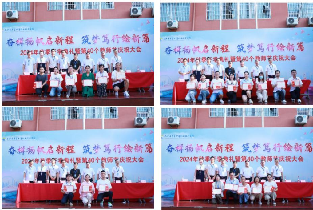
图 37 第 40 个教师节表彰大会

学校将师德师风建设融入校园文化建设，创新开展“优秀教师”“优秀班主任”“优秀共产党员”等评选活动，通过事迹报告、专题宣传片等形式，全方位展示优秀教师风采。建立“传帮带”机制，发挥优秀教师的示范引领作用，用身边人讲身边事，用身边事教育身边人。以教师节等重要节点为契机，开展形式多样的师德主题教育活动，激励广大教师争做“四有”好老师，为建设教育强国贡献智慧和力量。