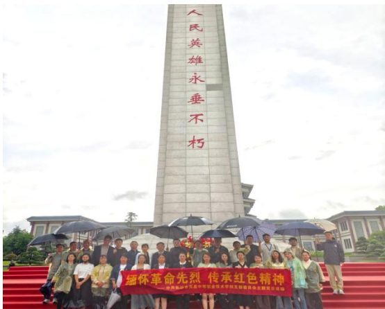
图6 湖南革命陵园祭扫活动