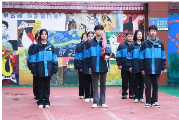
图 11 升旗仪式

旗仪式、敬老爱老志愿服务、文明清扫、主题手抄报等形式，集中开展“雷小锋”志愿服务系列活动，引导学生以实际行动践行雷锋精神，培养奉献精神和社会责任感。