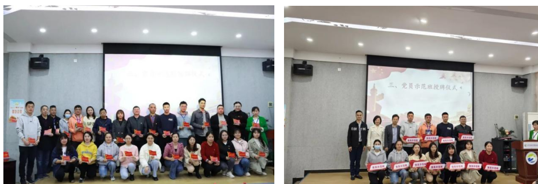
图3 党员示范岗、党员示范办公室、党员示范班授牌仪式

开展党员示范岗、示范班、示范办公室、示范课等活动。突出党员教师在教育教学工作中的先锋模范作用，推进党建工作与教育教学工作的深度融合，增加党组织的凝聚力、战斗力、吸引力，在全校教师中掀起争当“四有”教师的风气，引领全校教师争当教学模范、争当管理先锋，进而提高学校管理水平、工作效率和服务质量，促进学校全面有序发展。