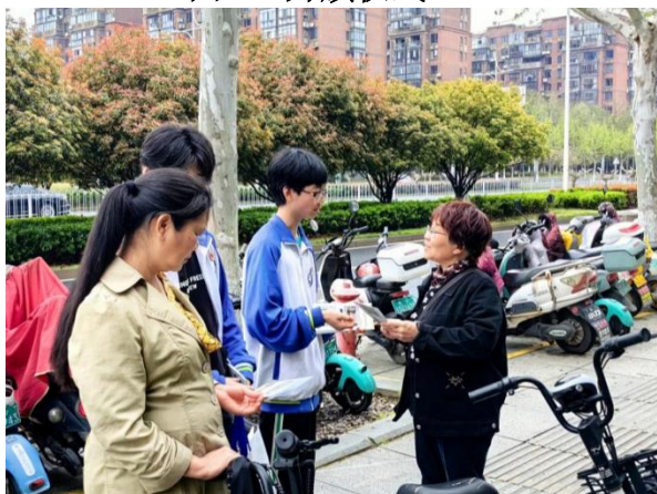
图 13 垃圾分类宣讲活动