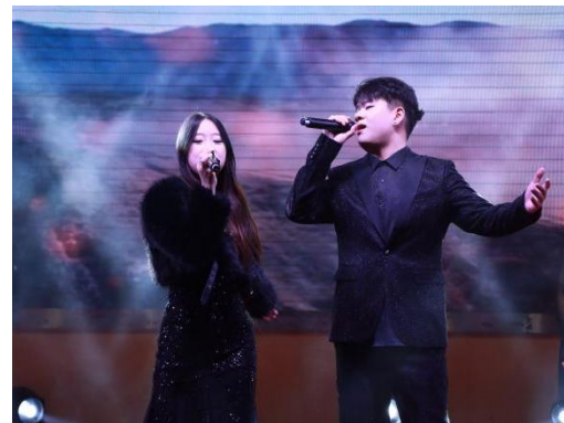
图 24 歌手大赛