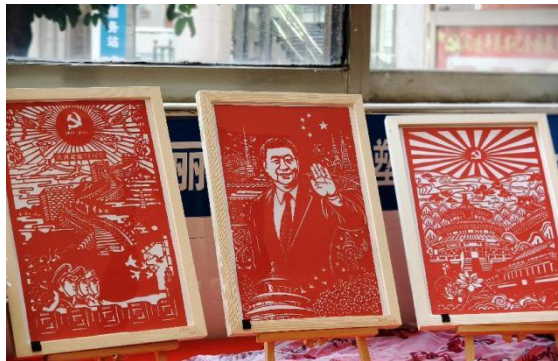
图 44 非遗刻纸