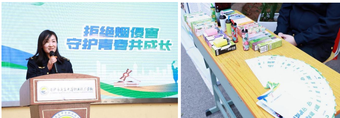
图 10 禁烟普法宣传教育活动

学校联合长沙市天心区烟草局、市场监督管理局及城管大队，共同开展了“拒绝烟侵害，守护青春共成长”普法宣传进校园活动。活动通过设立咨询台、发放宣传资料、展示普法宣传展板、现场答疑解惑等形式，向广大师生普及电子烟的危害及新型非法电子烟的识别方法，并深入解读相关法律法规，进一步增强师生的法律意识和健康意识，筑牢校园禁烟防线。