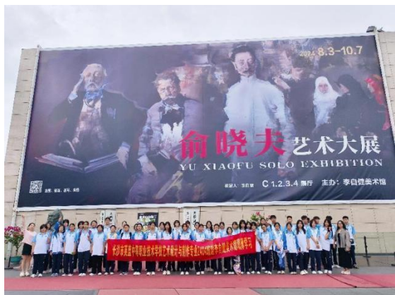
图 29 李自健美术馆研学活动