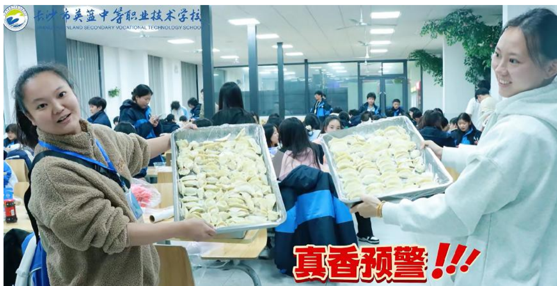
图 41 冬至包饺子活动

学校以传统节日为载体，创新开展“我们的节日”主题教育活动。在重阳节组织“敬老爱老”志愿服务，在立冬举办“包饺子”民俗体验，在劳动节开展“劳动最光荣”实践活动，在教师节举行“尊师重教”文艺汇演。通过丰富多彩的活动，让学生在亲身体验中感受传统文化魅力，增强文化认同感和民族自豪感。