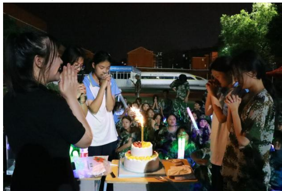
图 27 集体生日会