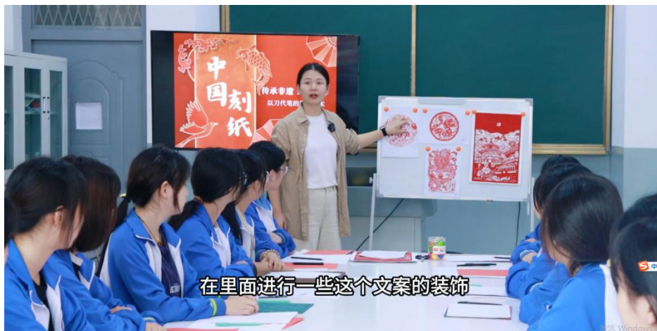
图 38 手工艺术刻纸授课

“传非遗”，中职学生传承非遗刻纸艺术，体悟非遗之美。刻纸作为一种非物质文化遗产，学生可以深入了解其历史背景和文化价值，增强对中华文化的认同感和自豪感。通过刻纸，学生不仅学习传统技艺，还能在此基础上进行创新，使传统文化在现代社会中焕发新的活力。