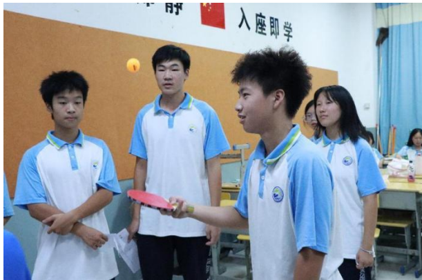
图 22 游园会