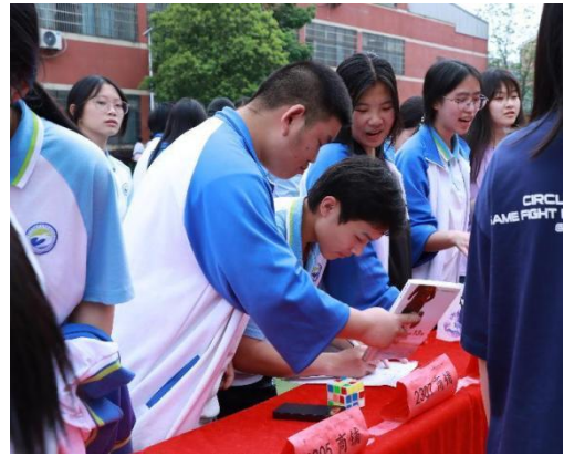
图 21 跳蚤市场