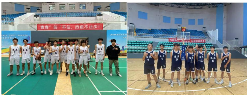
图 34 长沙市中职学校“文明风采”德育实践活动体育类竞赛