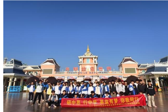
图 32 方特研学活动