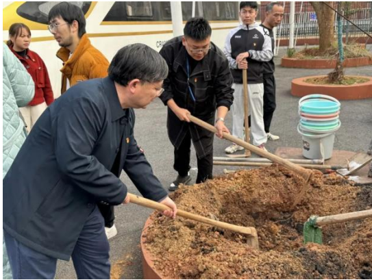
图4 “我为校园添点绿”植树活动

切身感受到来自学校大家庭的温暖。学校团委遵循学校教育发展，组建“火焰红”文化类、“创新蓝”竞技类、“活力橙”演艺类、“健康绿”综合类、“魅力粉”拓展类等五大板块共35个社团，提升学生的综合素养，丰富学生校园文化艺术生活。