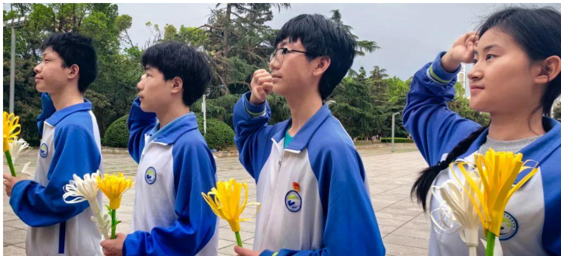
图 16 清明节缅怀先烈文明祭扫活动

校团委组织团员代表、班级团支部书记及学生代表前往湖南省烈士陵园，开展“铸魂·2024·清明祭英烈”文明祭扫活动。通过敬献花篮、默哀致敬、重温入团誓词等形式，缅怀革命先烈，传承红色基因，激励学生铭记历史、珍惜当下、奋发图强。