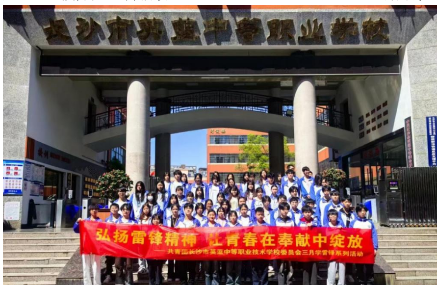
图 15 三月学雷锋系列活动