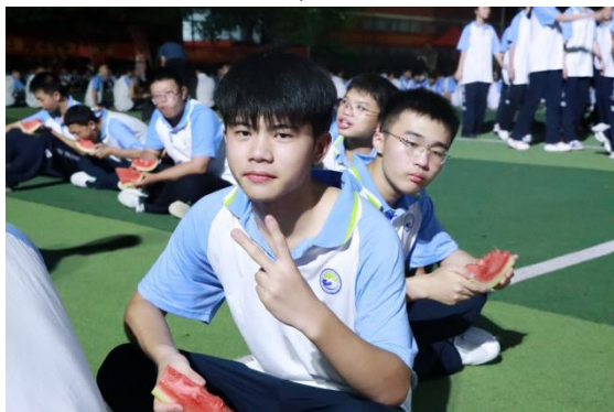
图 26 吃西瓜比赛

学校充分发挥共青团、学生会等学生组织和社团的作用，紧密围绕学生需求，开展了一系列学生喜闻乐见的校园活动。如吃西瓜比赛、拔河比赛、朗诵比赛、漫画比赛、集体观影、心理情景剧表演等，以及李自健美术馆、湖南省地质博物馆、铜官窑、世界之窗、方特等地的研学活动，进一步丰富了学生的校园生活，提升了学生的综合素质。