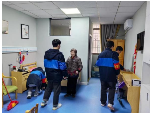
图 12 敬老院志愿服务