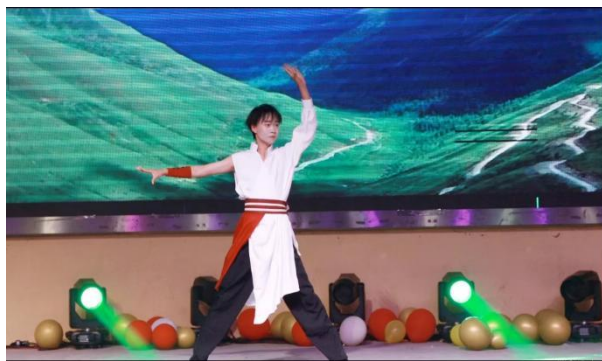
图 43 武术表演