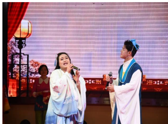
图 42 花鼓戏