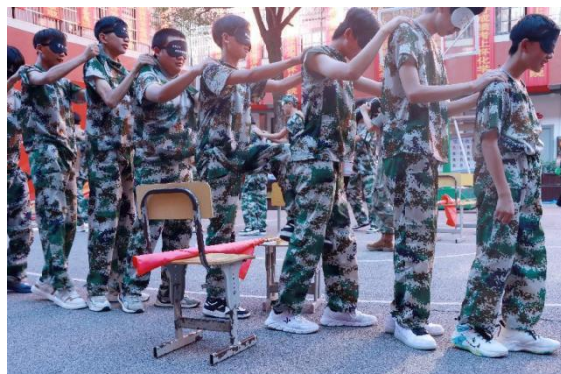
图 28 素质拓展活动