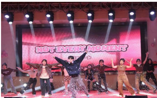
图 23 元旦晚会