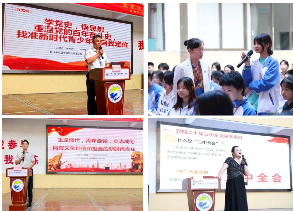
图2 第七期青年团校团课培训活动

校团委组织开展了第七期青年团校团课培训活动。本次活动一方面邀请党支部书记、优秀党员教师围绕党史、团史、共青团职能与使命等核心议题开展专题讲座，另一方面组织开展了系列志愿服务项目。学生走出校园，走进社区，将所学理论知识转化为服务社会、服务人民的实际行动。这种“接地气”的教育方式，不仅加深了学生对共青团性质、任务和目标的理解，也有效激发了他们的爱国情怀和社会责任感。