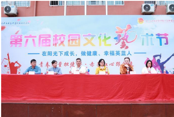
图 20 第六届校园文化艺术节开幕式

学校定期举办校园歌手大赛、迎新晚会、校园文化艺术节、元旦晚会等丰富多彩的文化活动，为学生提供展示自我风采的舞台，丰富课余生活，提升艺术修养。此外，学校还通过校园劳动节，组织全体师生进行校园大扫除，培养学生劳动意识和实践能力，营造整洁优美的校园环境。