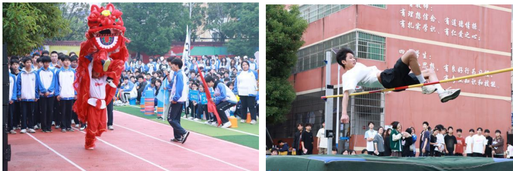
图 19 秋季运动会

学校积极开展楚怡读书行动，通过读书分享会、书法比赛、作文竞赛等形式，激发学生的阅读兴趣，提升写作水平，营造浓厚的书香校园氛围。同时，学校还举办了友谊篮球赛、运动会等活动，增强学生体质，培养团队协作精神。